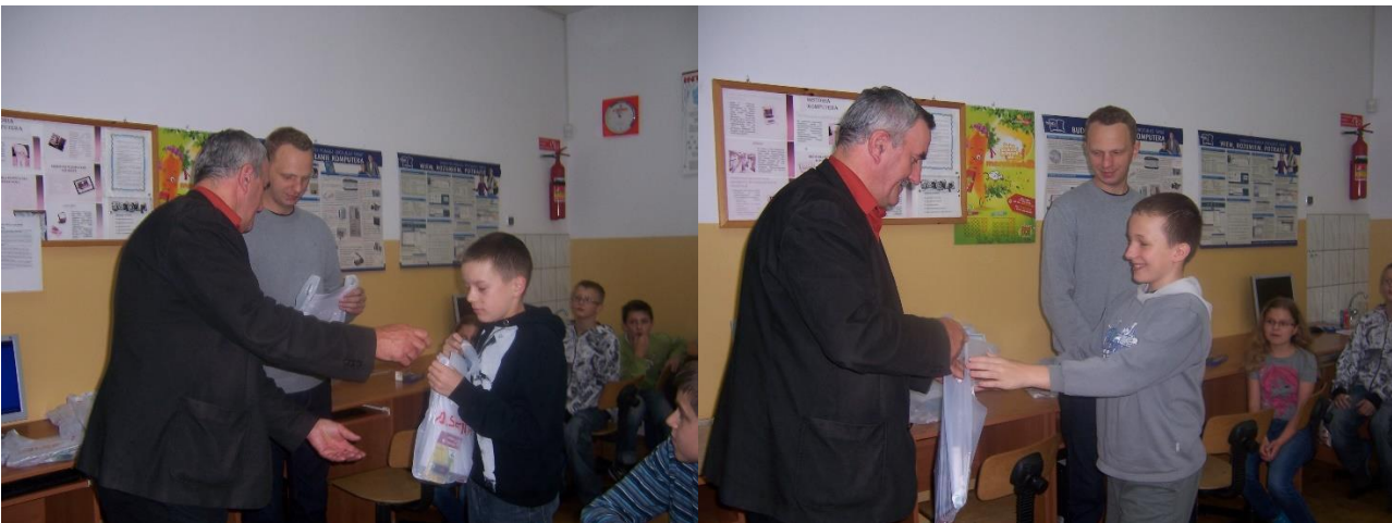
Dyrektor wręcza nagrody

Jako organizatorzy zabezpieczamy nagrody dla uczniów w postaci książek tematycznych lub innych gadżetów komputerowych typu klawiatura, myszka , pendrive, które uzyskujemy od sponsorów ponieważ od lat współpracujemy z Wydawnictwem „ Helion” oraz rabczańskim Studium „WIK” .