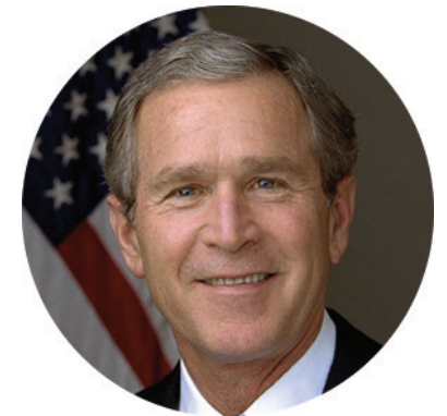
George W. Bush